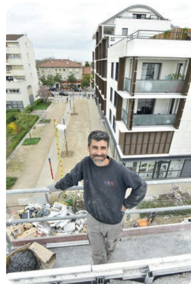
Le centre-ville poursuit sa mue autour de l'Espace Roger Pestourie