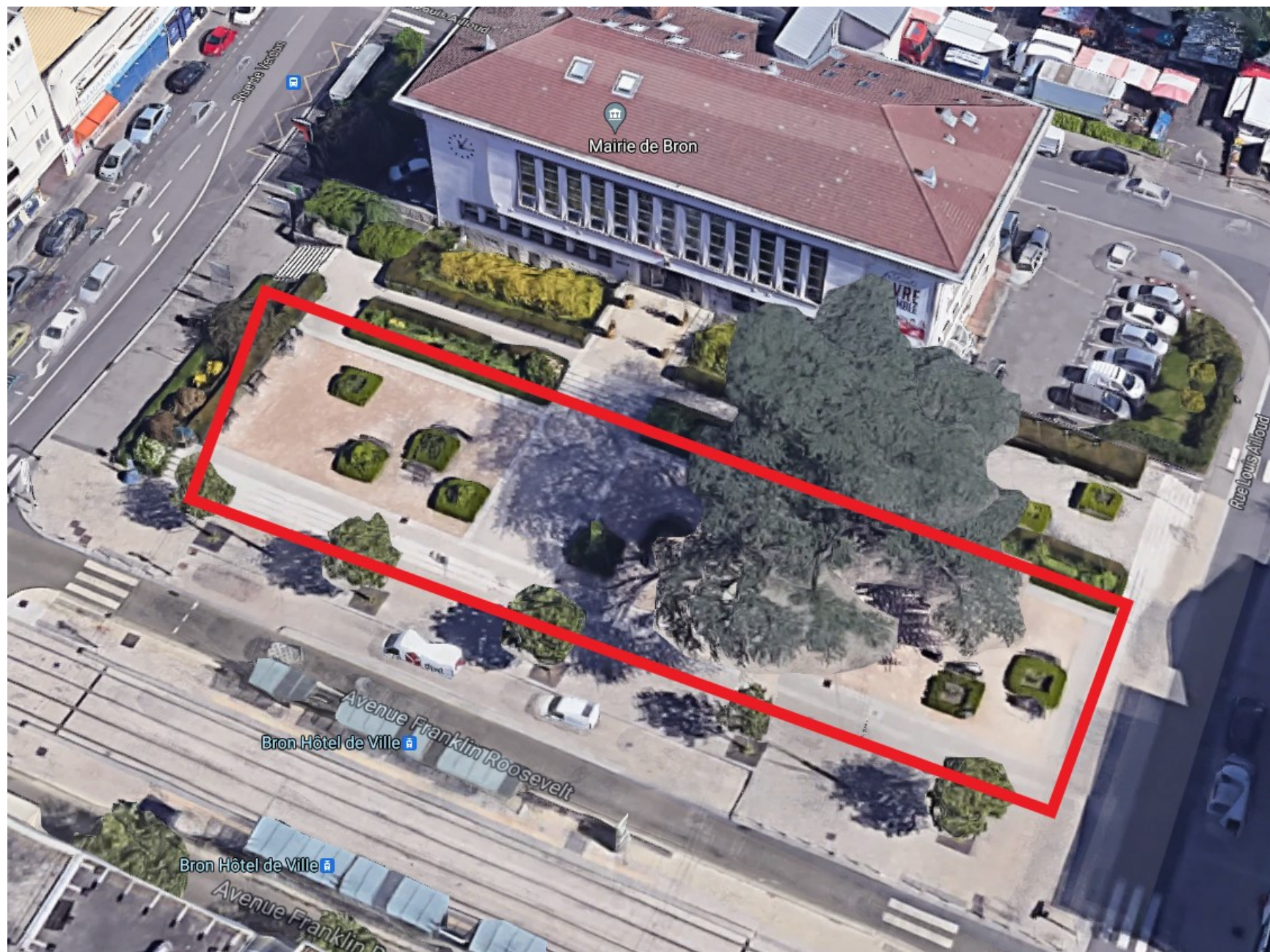
Marché de Noël 2021 – Sélection préalable des candidats