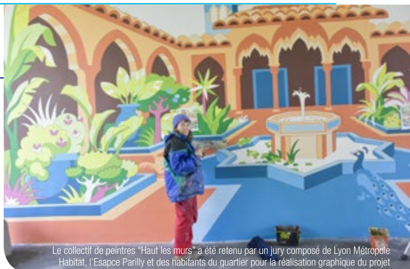
Le collectif de peintres "Haut les murs" a été retenu par un jury composé de Lyon Métropole Habitat, l'Espace Parilly et des habitants du quartier pour la réalisation graphique du projet