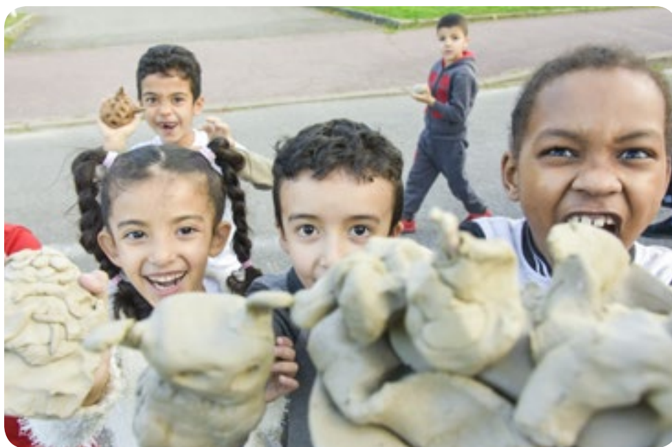
Déjà en octobre dernier, Arts et Développement proposait aux enfants de réaliser en modelage des "monstres" pour les accompagner ensuite à la Médiathèque pour une exposition "monstrueuse" !