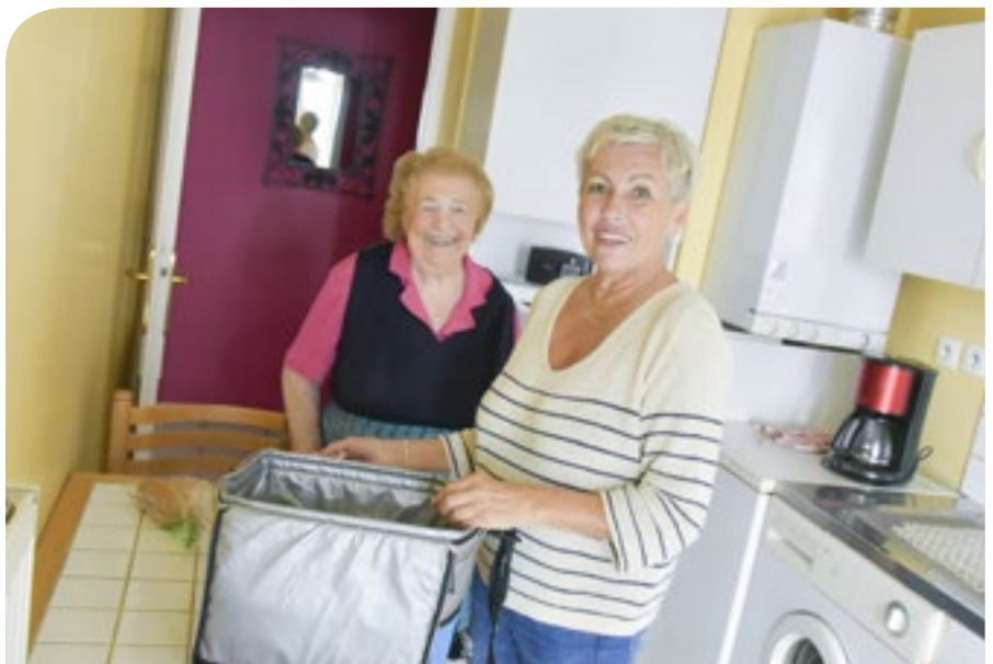
Le CCAS de la ville de Bron distribue tous les jours des repas aux personnes âgées.

Programme de Réussite Éducative et tous les partenaires institutionnels, notamment la Métropole, par les associations caritatives, humanitaires et d'insertion, les Centres sociaux, les Maisons de quartier... La solidarité est l'affaire de tous. Elle s'organise au sein d'un maillage essentiel pour soutenir celles et ceux qui en ont besoin. Car, ne l'oublions pas, chacun d'entre nous peut en avoir besoin..