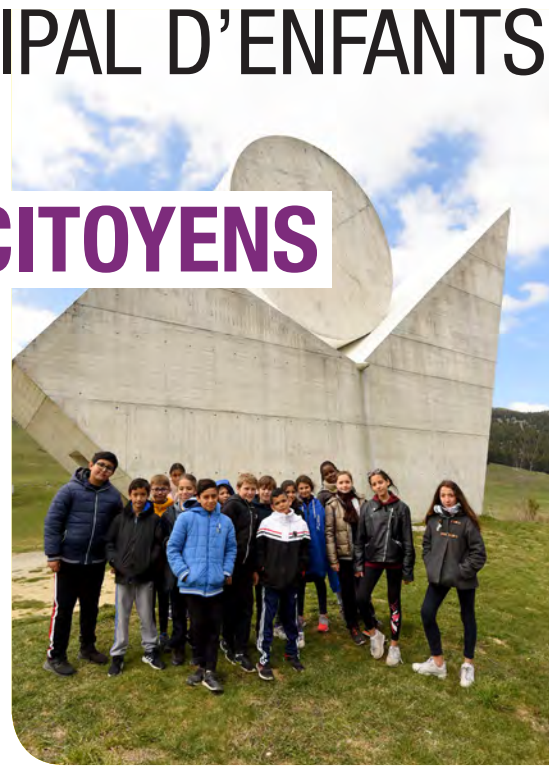
Les jeunes élus sortants du CME devant le Monument des Glières, sur le plateau du même nom, à l'occasion de leur sortie de fin de mandat à la découverte des Résistants et du maquis.

Des projets citoyens, solidaires, sportifs, culturels, environnementaux, numériques, scientifiques..., les écoliers et collégiens candidats en ont plein la tête. Le Conseil Municipal d'Enfants permet d'élire des représentants, qui, une fois installés dans des groupes de travail en novembre, débattent et mènent à bien des projets dans ces domaines variés. Lieu d'expression des adultes de demain, le CME développe la citoyenneté des enfants et permet de reconnaître leur place dans la cité. Lieu d'apprentissage de la responsabilité et de l'autonomie, il permet également la rencontre d'enfants de tous les quartiers. Rapidement après l'installation du CME, les jeunes Conseillers échangent leurs points de vue, livrent leurs expériences de vie... et montent des projets collectifs, concrets, pour l'épanouissement de leurs pairs. Ils rencontrent également des adultes, professionnels, membres associatifs, personnes âgées, anciens combattants..., et suivent l'actualité brondillante.