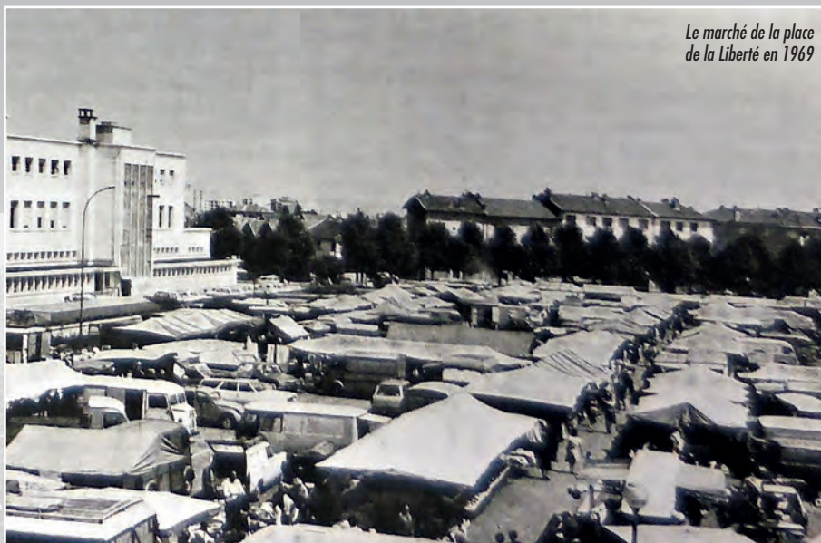
Le marché de la place de la Liberté en 1969

Le succès de ce marché est immédiat, acheteurs et vendeurs venant nombreux autour des étals. Tant et si bien que, à peine quatre mois plus tard, en juin 1923, les habitants du quartier des Essarts obtiennent à leur tour la création d'un "marché d'approvisionnement local" , qui se tiendra tous les dimanches matin "sur le trottoir de la route nationale (avenue Franklin-Roosevelt), entre le boulevard Pinel et la rue Laborde" . L'on imagine les voitures circulant sur la route nationale, peinant à trouver leur chemin au milieu des charrettes ou des tacots des forains... Le même problème se pose avec encore plus d'acuité lors du marché du lundi, qui voit la foule remplir toute la place de l'Hôtel de Ville et déborder dangereusement sur la nationale, au point de gêner la circulation. Aussi décide-t-on, en 1936, de déplacer les étals alimentaires