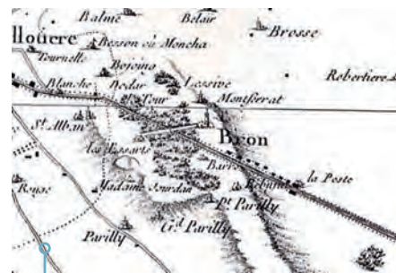
Frontière du Dauphiné et du Lyonnais, d'après la carte de Cassini (vers 1750)