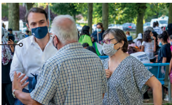
Le Maire à la rencontre des Brondillants sur les marchés

C'était une nécessité de reprendre les choses en mains. Il y avait un laisser-aller qui n'était plus acceptable. Beaucoup de Brondillants nous l'ont dit. Nous avons décidé, avec les