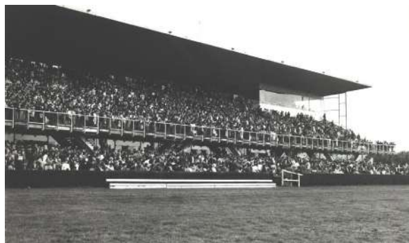
La tribune officielle copieusement garnie le 23 mai 1974