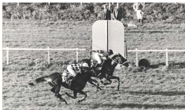
Une arrivée disputée le 13 mai 1968