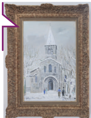
L'église Saint-Denis, Bron (1933) de Maurice Utrillo © Collection de la Fondation Léa & Napoléon Bullukian © Adagp, Paris 2023

Un nouveau rendez-vous haut en couleurs au printemps sur 3 années pour découvrir les œuvres d'art issues de la collection de la Ville : c'est que propose la médiathèque Jean Prévost avec « Accrochez-vous ». Pour la première édition qui se déroulera du 16 mai au 3 juin , les paysages seront à l'honneur. Une façon de redécouvrir Bron et d'inviter au voyage !