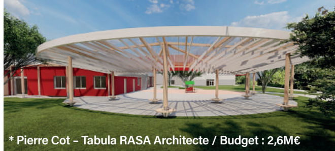
* Pierre Cot – Tabula RASA Architecte / Budget : 2,6M€

Concernant Pierre Cot , une première étape s'était déroulée à l'été 2022 avec l'extension du réfectoire et l'installation de salles de classe en maternelle. La seconde, plus importante, débutera dès cet été en site occupé pour une période d'un an et concernera, cette fois, un agrandissement de l'école élémentaire. Au programme : la restructuration des espaces à l'étage pour avoir désormais 3 salles de regroupement (12 à 14 élèves) et au rez-de-chaussée, les créations d'une salle de classe supplémentaire, d'une BCD, d'une salle périscolaire qui sera mutualisée avec l'accueil de loisirs du Centre social Gérard Philipe les mercredis et vacances, d'un bureau, d'une salle